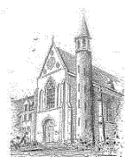
Parochie O.L.V. Onbevleekt Ontvangen Zenderen